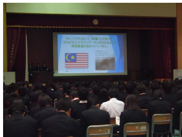
(全体研究発表風景)