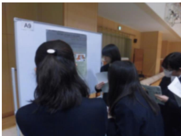
(課題研究発表風景①)

去る2月23日(金)、本校第一、二体育館・柔剣道場を会場に、SGH課題研究発表会が行われました。高校1、2年生の先輩方が研究の成果を発表するのを、中学校3年生が参観し、課題研究について理解を深めました。中には、高校1年生から英語での発表・ポスター作成をしている生徒もおり、中学校3年生たちは刺激を受けると共に、1年後、2年後の自分たちをイメージすることができ、実り多き時間となりました。