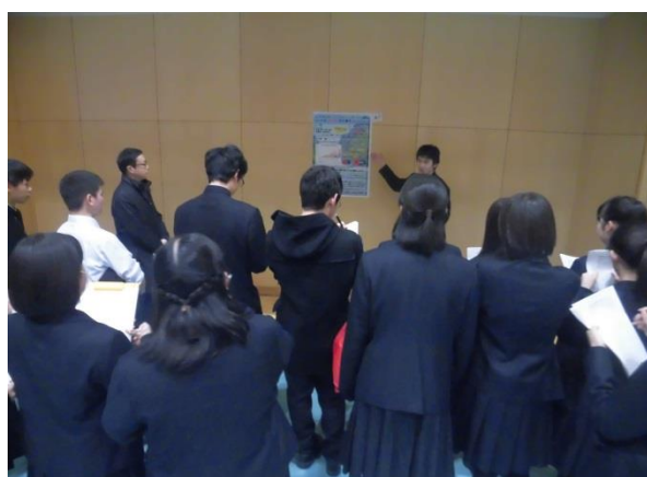
(課題研究発表風景④)