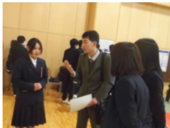
(課題研究発表風景③)