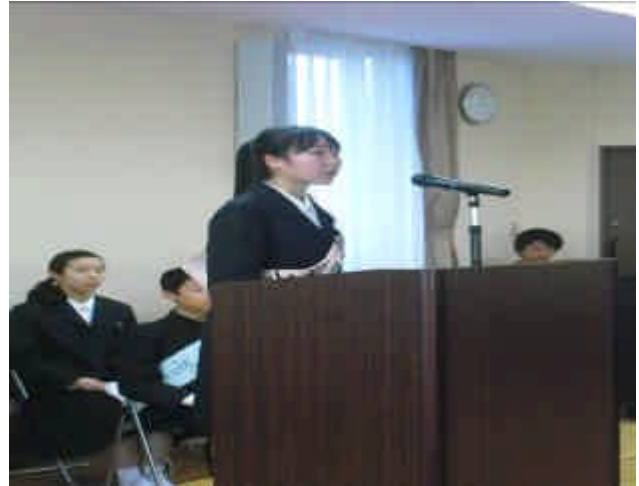
（ 候補者の演説 ）