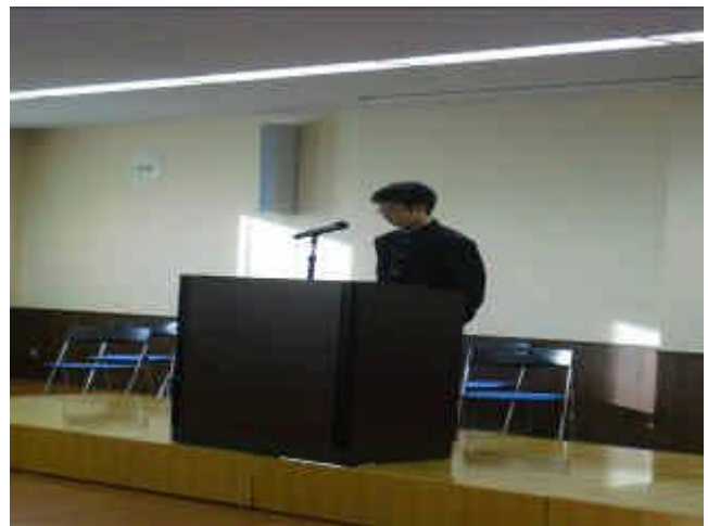
（選挙管理委員による投票方法の説明）

投票の結果、2年生の会長・副会長候補は信任され、1年生の副会長は立候補者4名の中から1名が選出されました。今までの執行部同様、全校の強力なリーダーとしての活躍を期待しています。仙台二華中学校生徒・教職員300名以上が支援しています。