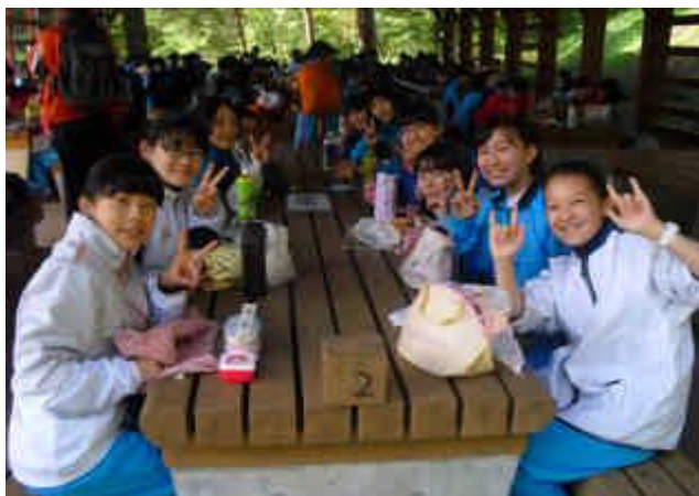
( 昼食途中に はいポーズ )