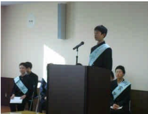
（ 候補者の演説 ）