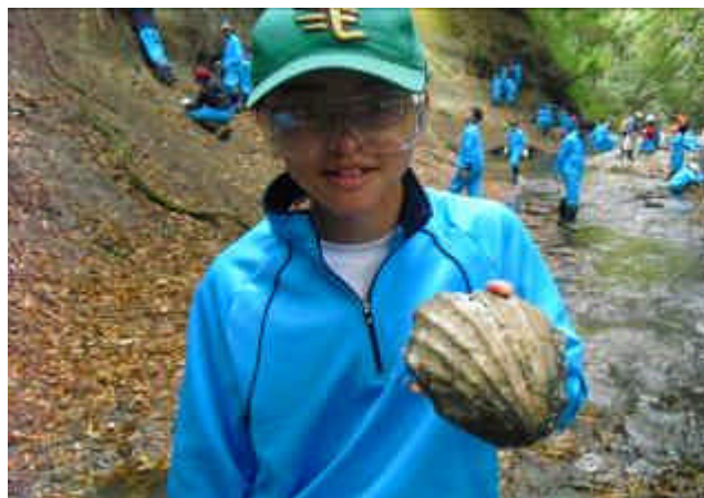
( 巨大化石をゲット! )