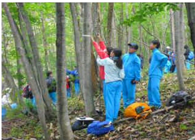
( 班員と協力しながら観測し、データを集める )

午後の焼河原での化石採集は、午前中の観測や徒歩移動の疲れを見せず、一人一人が集中して採集に取り組んでいたようです。