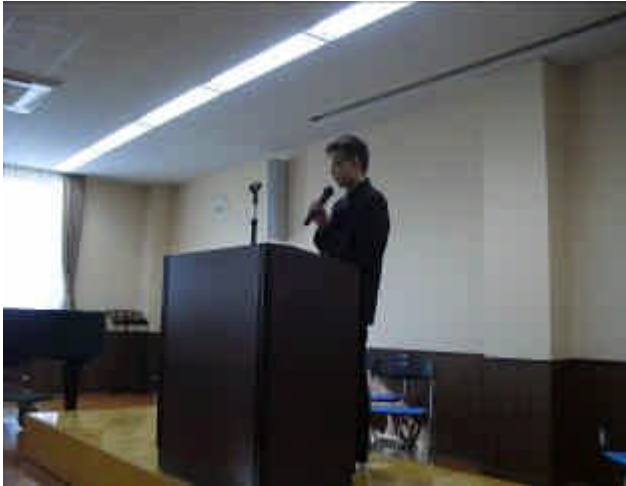
（選挙管理委員長のあいさつ）

10月19日（水）7校時に生徒会長・副会長を選出するための立会演説会・選挙が行われました。仙台二華中学校のリーダーを選出する、とても大切な時間になりました。18才選挙権が導入され、本校でも高校3年生には国会議員等を選ぶ選挙権をもっている人がいます。中学生も3～5年後には、その選挙権をもつこととなります。民主主義の根本である選挙がもつ重みを、今のうちから、しっかり認識できる生徒を育てたいと思っています。