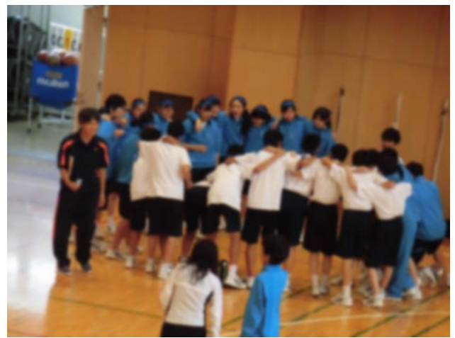
学級で円陣を組み、士気を高める生徒たち