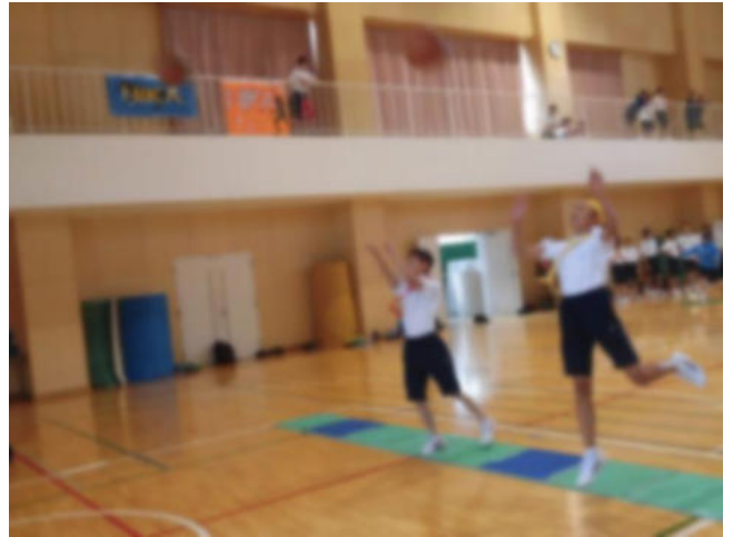
縦割り対抗ボールリレー