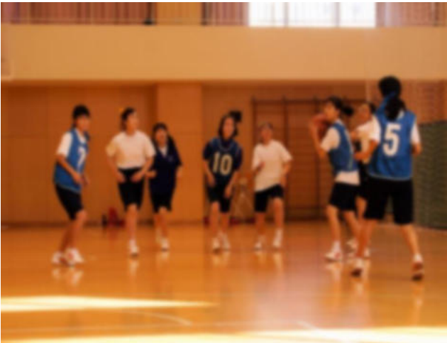
3年生バスケットボール