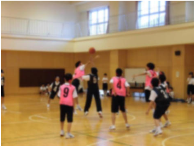
1年生バスケットボール