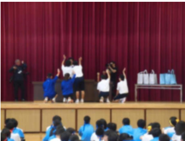
3年生実行委員による選手宣誓