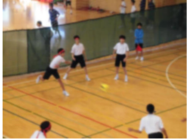
2年生ドッジボール