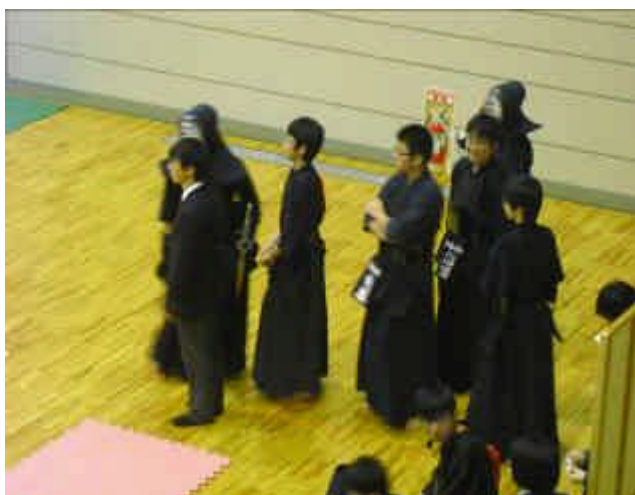
（ 団体戦前 整列を待つメンバー ）

団体戦は1回戦で僅差での惜敗、個人戦は1回戦を突破したものの強豪校との戦いで惜敗という結果になりましたが、仙台二華の代表としてはもちろん、仙台市の代表として堂々とした戦いを披露しました。