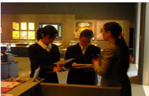
（ 東北歴史博物館スタッフからの説明を聞く ）