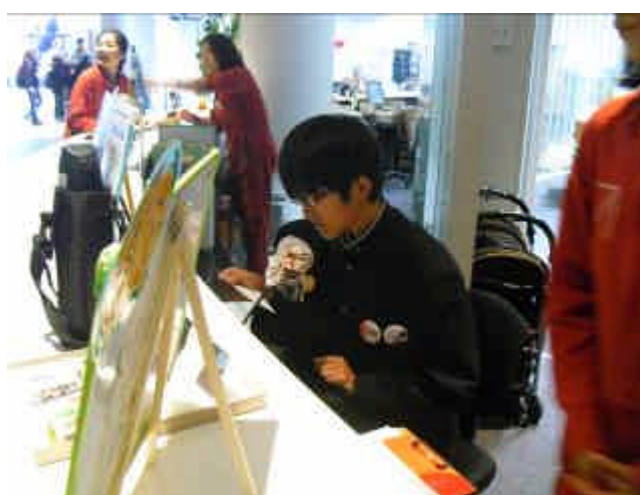
（ 天文台の来訪者に向けてのアナウンス ）