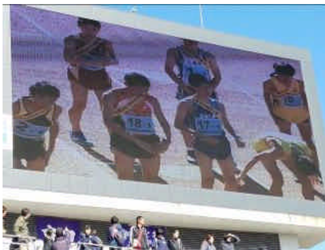
（ スタート直前 緊張の第一走者 ）

東北6県から22チームが参加した大会で力走り、上位入賞はなりませんでしたが、14位に入る健闘をみせました。昨年の夏から1年以上にわたり厳しい練習に取り組んできた姿は立派で、全校に大きな影響を与えました。これまでの努力に改めて心からの拍手を送りたいと思います。