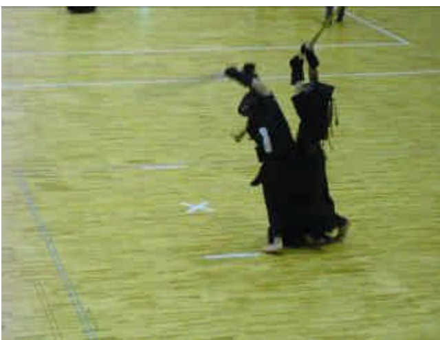
（ 団体戦での激しいぶつかり合い ）