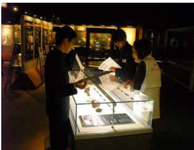
（ 天文台スタッフの説明に聞き入る様子 ）

11月10日（木）11日（金）に、2年生は県内各地の方々の協力のもと、職場体験学習を行いました。キャリア教育の一環として、働くことの喜びややりがい等を実体験を通して学ぶ貴重な機会となりました。