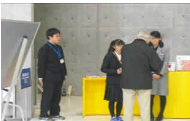
（ 博物館来訪者のチケットを回収する ）